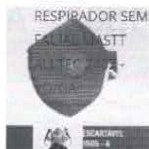
RESPIRADOR - 1/4 DESCARTÁVEL PFF1 V (S) 1505 - X0