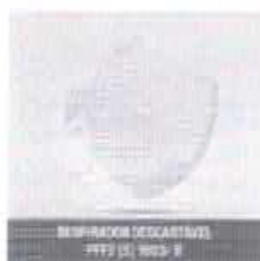
RESPIRADOR DESCARTÁVEL - PFF2 (S) 1503 - B