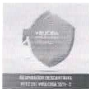
RESPIRADOR DESCARTÁVEL - PFF2 (S) 1511 - C VIRUCIDA