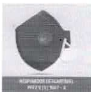
RESPIRADOR DESCARTÁVEL - PFF2 V (S) 1507 - A