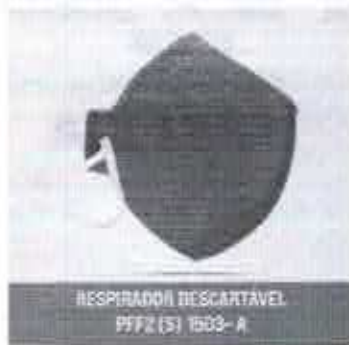
RESPIRADOR DESCARTÁVEL PFF2 (S) 1503 - A